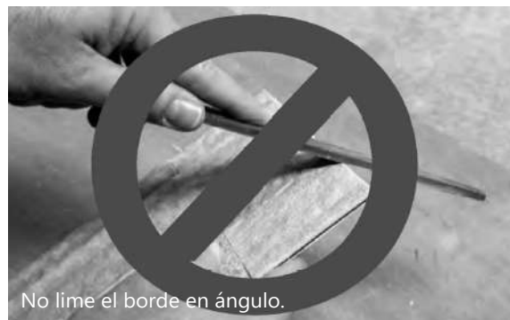
No lime el borde en ángulo.