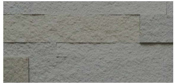
Piedra con imprimante / sellador (imagen referencial)