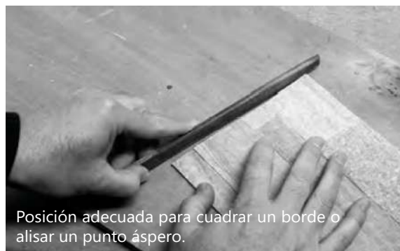
Posición adecuada para cuadrar un borde o alisar un punto áspero.

Si lo desea, use una lima de metal para desbarbar los bordes cortados.