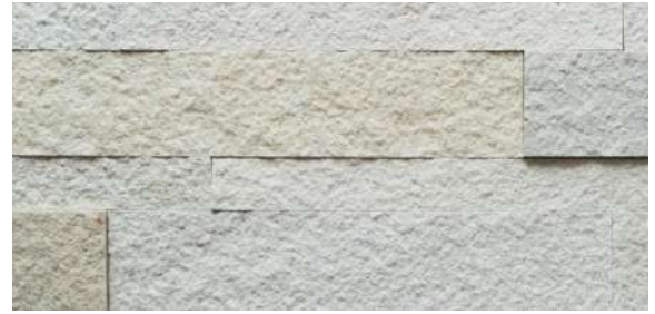
Piedra en bruto

Los selladores / mejoradores de piedra son un revestimiento duradero que se adhiere a la superficie de la piedra. Estos productos oscurecen ligeramente el color de la piedra, se ven húmedos y tienen un acabado brillante. Siga las instrucciones del fabricante.